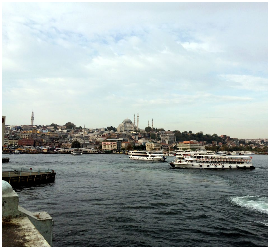
Istanbul var rammen om den økologiske verdenskongres i 2015.

For de bønder, hun taler om, vil agro-økologiske dyrkningsformer