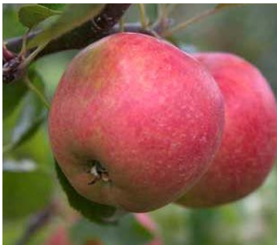
Sansa er en Japansk sort, som er med i sortsafprøvning for anden gang. Det er en produktiv og uproblematisk sort, som også klare sig rimeligt under helt usprøjtede forhold. Det er en tidlig sort, som kan være et alternativ til Discovery og holde sig, til det er tid til Aroma. Smagen burde ramme nutidens unge, da frugten er sprød og sød uden nogen specielt markant smag.