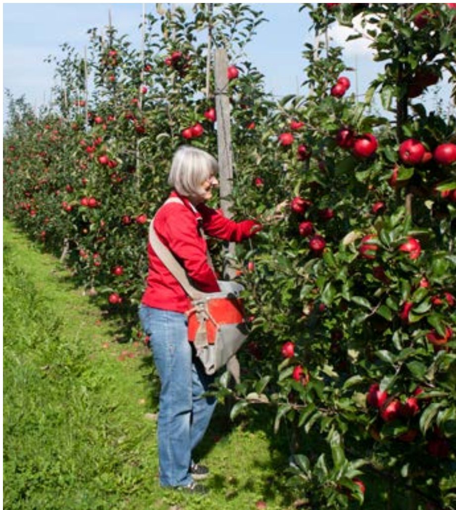
Sorten Gaia er utrolig produktiv, frugten er smuk og træerne er sunde og velproportionerede, men frugtkvaliteten og holdbarheden har ikke været overbevisende. I 2014 gennemføres forsøg for at undersøge om det er lagringsmetoden (alm. kølelager) der er skyld i den dårlige holdbarhed.