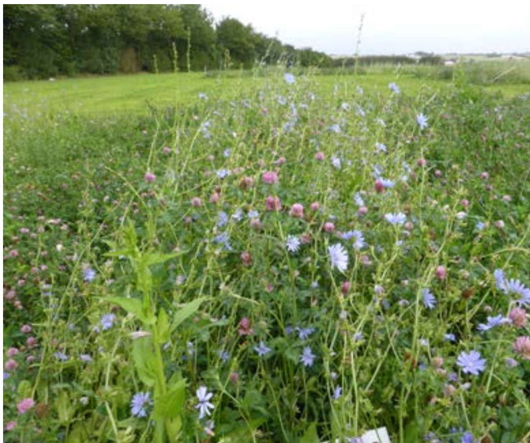
Græs, lucerne, kællingetand og bibernelle har alle en forholdsvis stor reduktion i fordøjelighed over tid, mens kommen og mælkebøtte ikke ændrer sig meget i fordøjeligheden.

urter, har vi opbygget meget viden om vækst og kvalitet, og der er nu flere dokumenterede positive effekter.