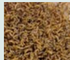
Levnede fluelarver dyrket i fjerkrægødning part til fodring af økologiske høner

Torsdag 13. november inviterer Teknologisk Institut og inSPIRe til en stor endags-konference om insekter. Her vil du kunne høre mere om de aktuelle muligheder og barrierer for insektproduktion og få indsigt i potentialet for brug af insekter i forskellige dele af fødevarer- og fodersektoren.