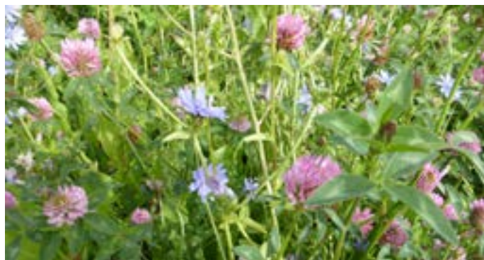
Hvis en græsmark skal være artsrig, er det nødvendigt med et design, der tager hensyn til de enkelte urters konkurrenceevne.

Græs og hvidkløver indgår ikke i blandingen for at begrænse konkur-