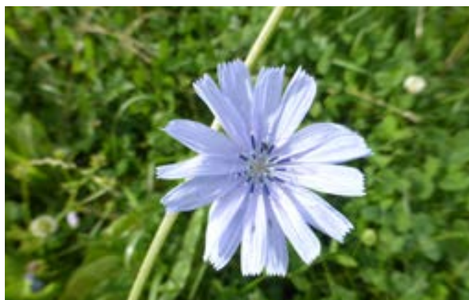
Der mangler stadigvæk meget viden for at kunne designe marker til forskellige formål.

dringerne. Den er svær at styre på samme måde som kløverandelen ikke kan bestemmes ud fra frøblandingen. Hvis der er behov for en specifik sammen-