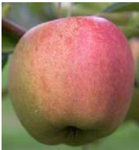
Maribelle fik bedste karakter for spisekvalitet, men udbytterne har ikke været imponerende og heller ikke i sæsonen 2014 kommer der mange frugter på træerne.

I projektet er der hjemtaget 27 sorter fra forskellige forældre i hele Europa og sorterne er testet under danske økologiske forhold i forsøgsplantagen i Årslev med det formål at finde sorter, som helt eller delvist kan leve op til de mange krav der stilles til en økologisk æblesort. I projektet er sorterens produktivitet målt og sundhed og træform bedømt. Frugternes plukketidspunkt, lagerevne og hyldeliv (Figur 1) er undersøgt. Alle sorter er analyseret for kvalitetsparametre som fasthed og sukker/syre balance og endelig er frugterne smagstestet af et panel af lægfolk, der alle har arbejdet med æbler i mange år.